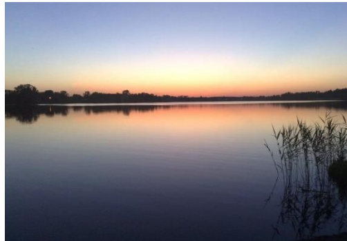
Городское водохранилище в центре города