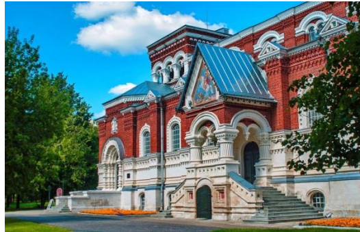
Георгиевский собор, в котором расположен Музей хрусталя им. Мальцовых