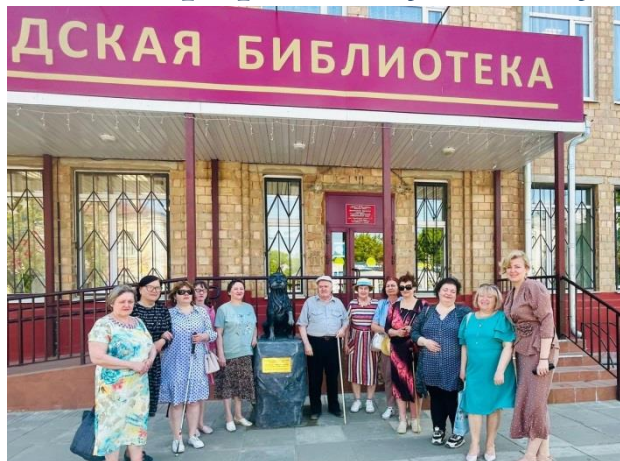
Фото мероприятий клуба «Стимул»