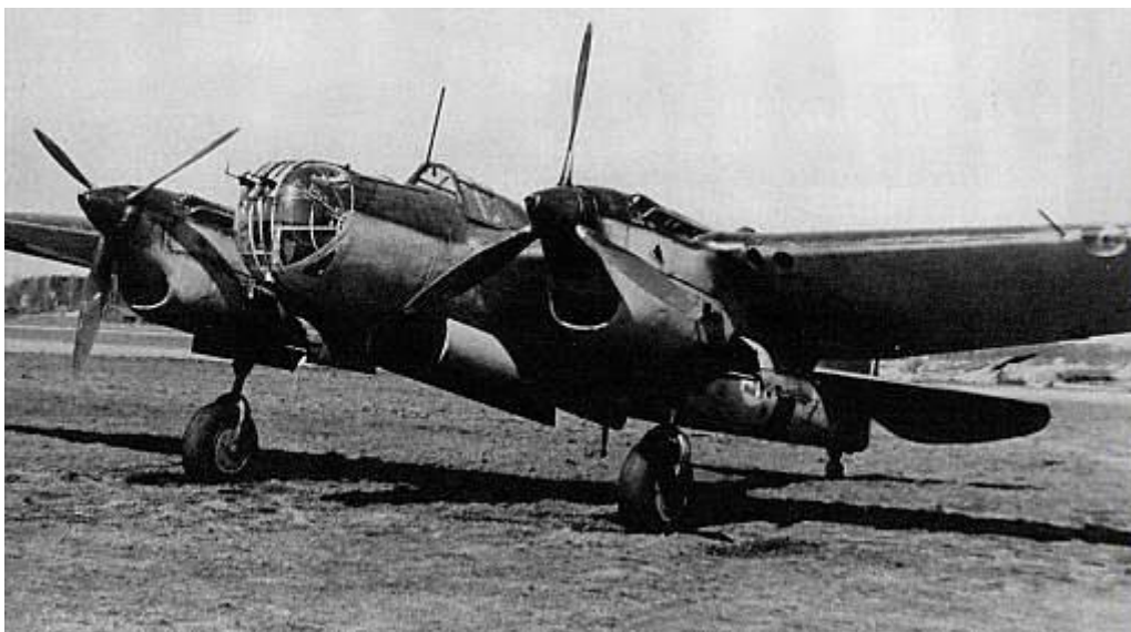
СБ АНТ-40 - скоростной фронтовой бомбардировщик