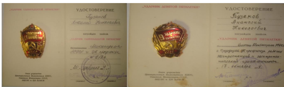
Знаки ударник 9 и 11 пятилетки