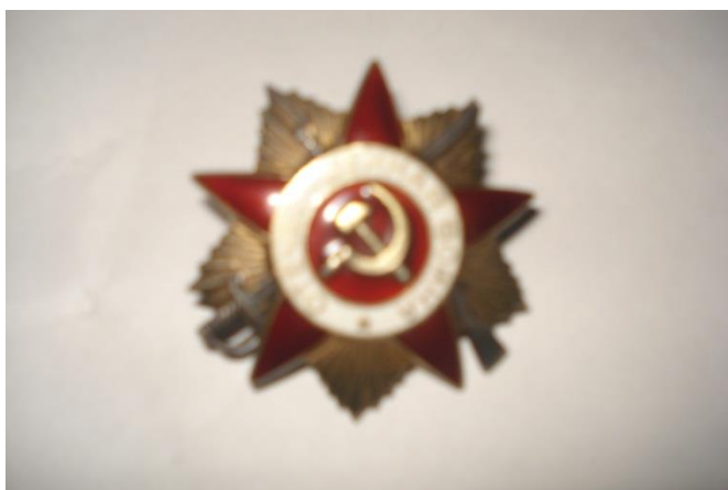
Орден Великой Отечественной войны

Для фронта сдавали каждый день по три литра молока с каждой коровы.