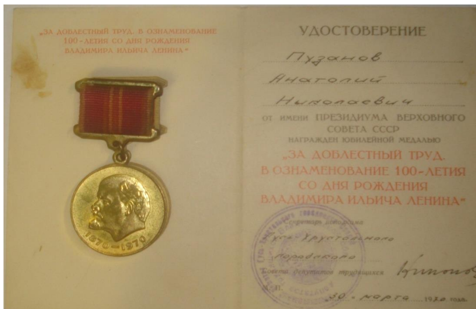
Медаль за доблестный труд