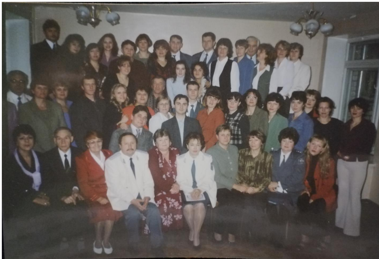
Коллектив налоговой инспекции по Гусь-Хрустальному району